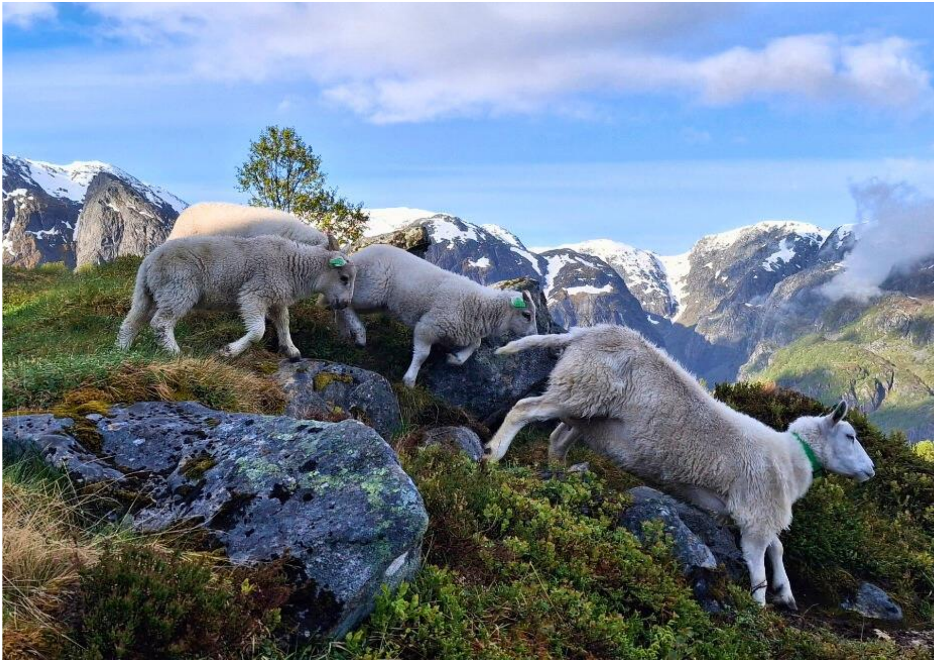
Les habitants des lieux