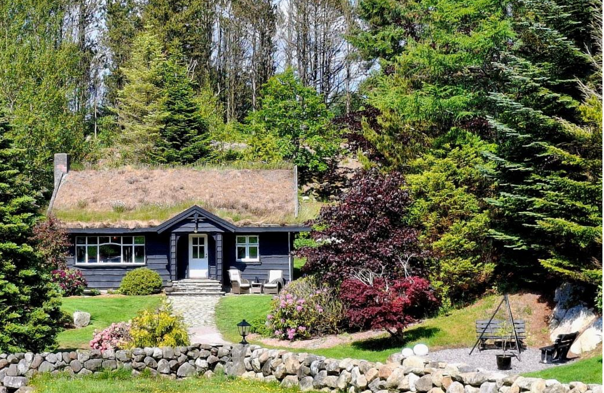
Chalet d'été, typique du coin