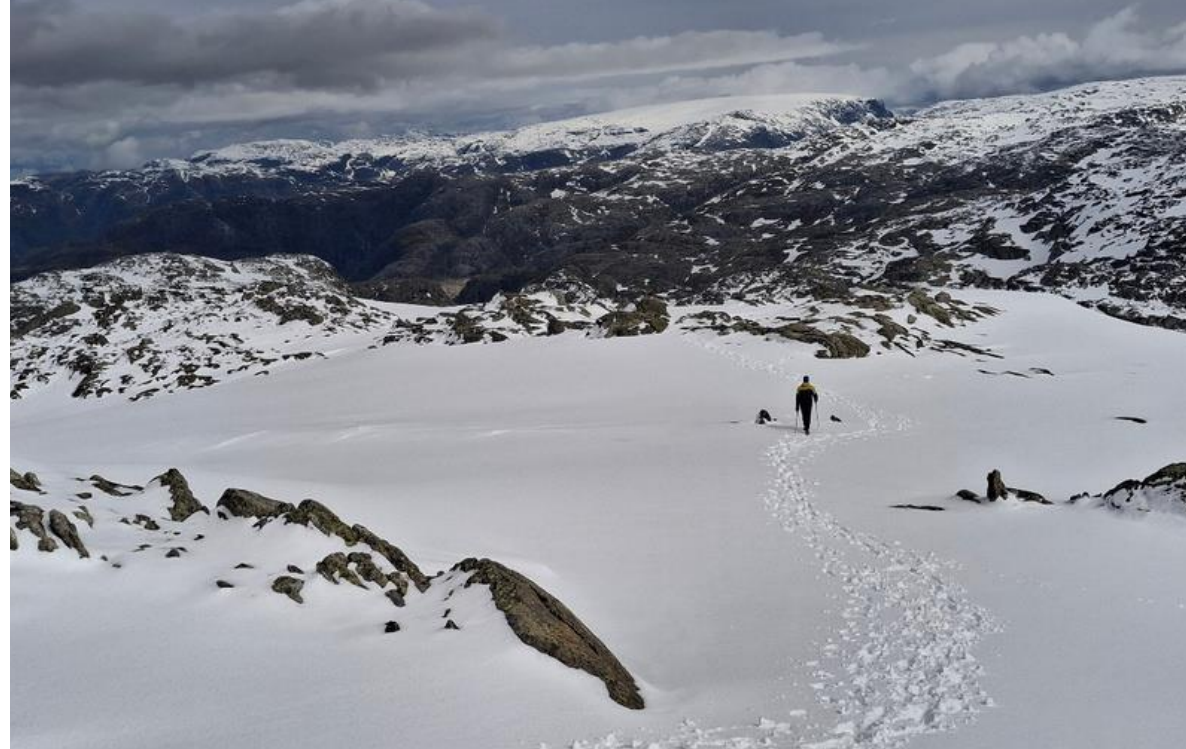
Le sommet enneigé du mont Fonnanuten à 1454m d'altitude